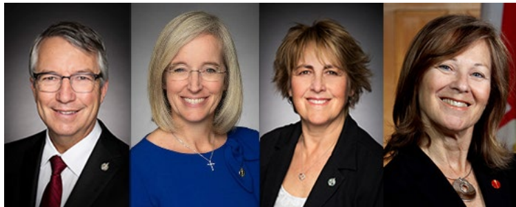
Lloyd Longfield, Tamara Jansen, Carol Hughes et la sénatrice Judith Seidman

Nous remercions sincèrement les responsables du CPRS 2021 qui ont contribué à la réussite des événements virtuels de cette année : M. Lloyd Longfield, Chair (Libéral), M me Tamara Jansen, vice-présidente (Conservateur), M me Carol Hughes, vice-présidente (NDP) et la sénatrice Judith Seidman, représentante du Sénat.