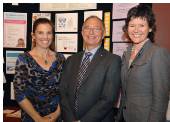
(de g. à d.) Mme Kirsty Duncan, députée, le sénateur Kelvin Ogilvie, et Mme Megan Leslie, députée

Le Comité sur la recherche en santé que Recherche Canada a établi en 2009 suscitera beaucoup d'intérêt parmi les parlementaires au cours de la prochaine année, surtout à cause des activités à venir axées sur la recherche sur le cerveau (au printemps 2012), les grappes d'innovation (à